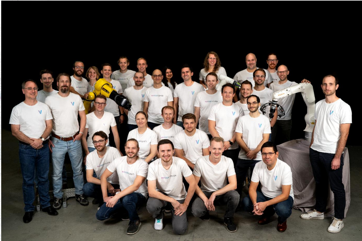
Bild: voraus.champions mit über 200 Jahren Erfahrung in Robotik und SW-Entwicklung.

Wir begleiten und unterstützen Sie bei Ihrem Vorhaben, die eigene Automatisierung auf das nächste Level zu heben. Wir bieten individuelle oder produktbezogene Beratung und Entwicklungsdienstleistungen, die auf Sie zugeschnitten sind. Von der Software-Architektur über die Auswahl des Roboters, Komponenten und Technologien und deren Implementierung, das Testen und die Simulation bis hin zur Ausführung – Sie entscheiden und wir liefern.